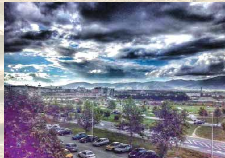
Облаци - Моника Станоевска