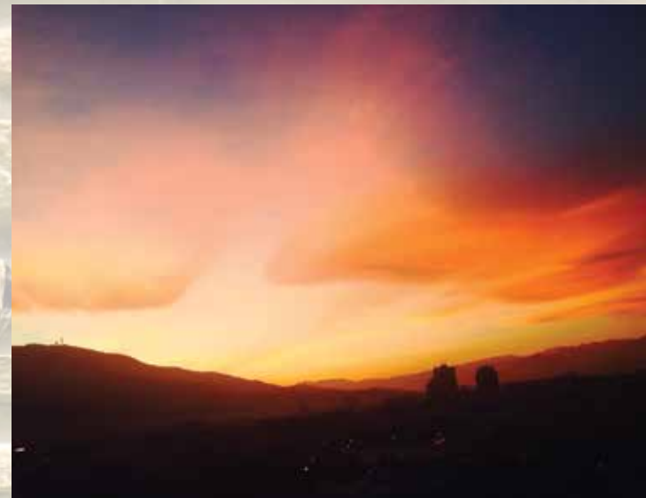
Зајдисонце - Надица Станковиќ