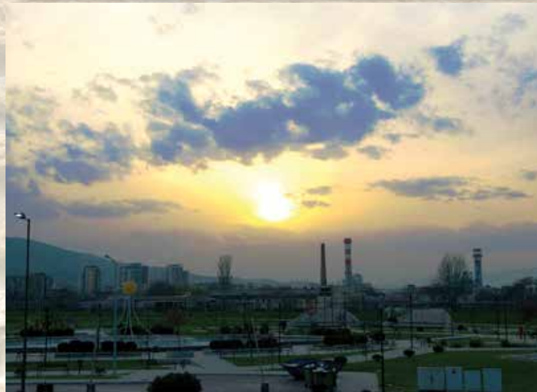
Небо над паркот со езерата - Леонид Настески