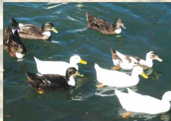
Пајки - Ксенија Тодорова